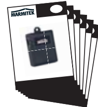
1x Quick Start Guide with link to user manual in English, Deutsch, Français, Espanol, Italiano, Nederlands