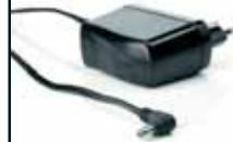
1x Energy saving switched mode power supply