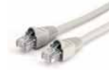
1x RJ45 network cable